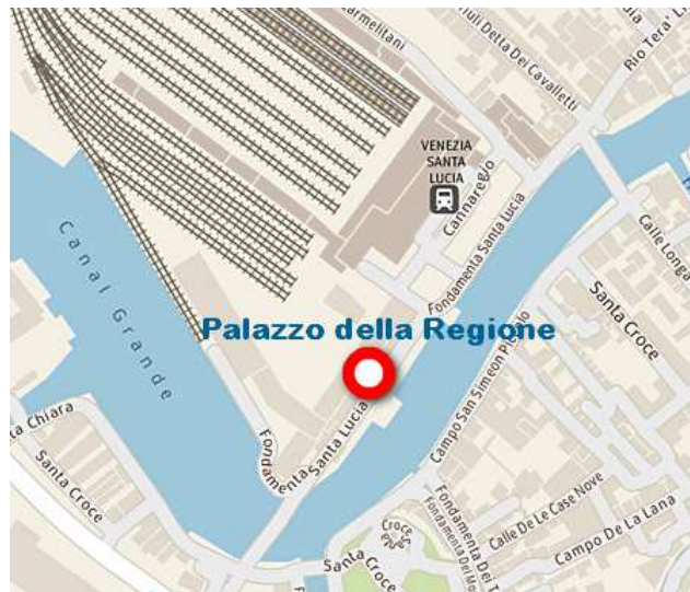
Sede del convegno